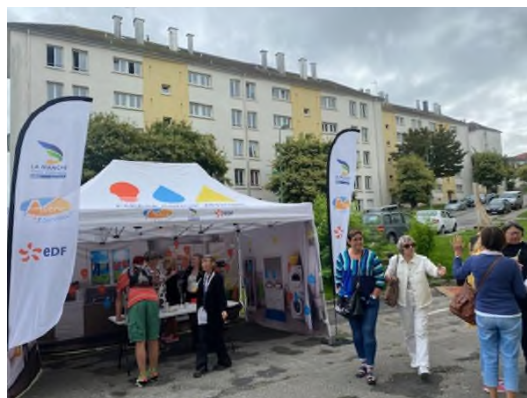
Journée « zen attitude en bas d'immeuble » dans le quartier de Charcot Spinel le 13 septembre