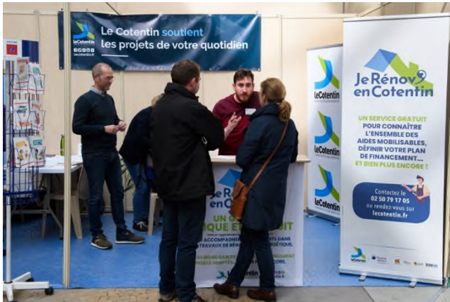
Stand du salon de l'habitat 2023

La rénovation des logements privés constitue une priorité de l'agglomération du Cotentin. Pour favoriser les travaux d'économies d'énergie dans un contexte de flambée des prix de l'énergie, l'agglomération a poursuivi le déploiement de sa politique de soutien aux habitants en 2023. Ce soutien aux habitants se compose d'une part, d'un service d'information, de conseil et d'accompagnement à la définition et au montage de projet et d'autre part, d'aides financières à la rénovation énergétique. En parallèle de ces deux actions, l'agglomération a mené sa première campagne de communication avec sa marque « Je Rénov' en Cotentin » qui s'est étalée sur toute l'année. En 2023, le service a ainsi accompagné 2 500 ménages et financé près de 140 rénovations de passoires thermiques, sur le territoire de l'agglomération