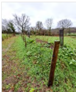
Aménagement sur la ferme de Caroline à Négreville

offrent la possibilité aux habitants de faire des commandes groupées d'arbres et d'arbustes adaptés à la flore locale. Depuis son lancement, cumulé à l'opération 10 000 arbres, ce dispositif a permis de replanter près de 13 km de haies dans le Cotentin.