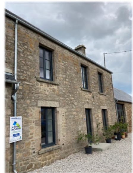
Logement soutenu par l'agglomération