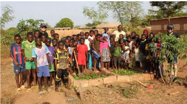
Réalisation de compost dans le jardin maraîcher de l'école de Koubanao

Ce dispositif impose une participation financière de l'ensemble des acteurs du projet avec au minimum 10% pour la commune Sénégalaise et 20% pour la collectivité française. Le montant est plafonné à 50 000 € par an et par projet.