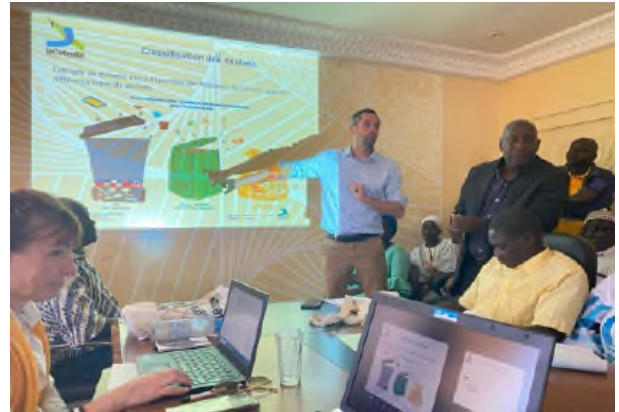
Intervention en conseil municipal de Koubalan.